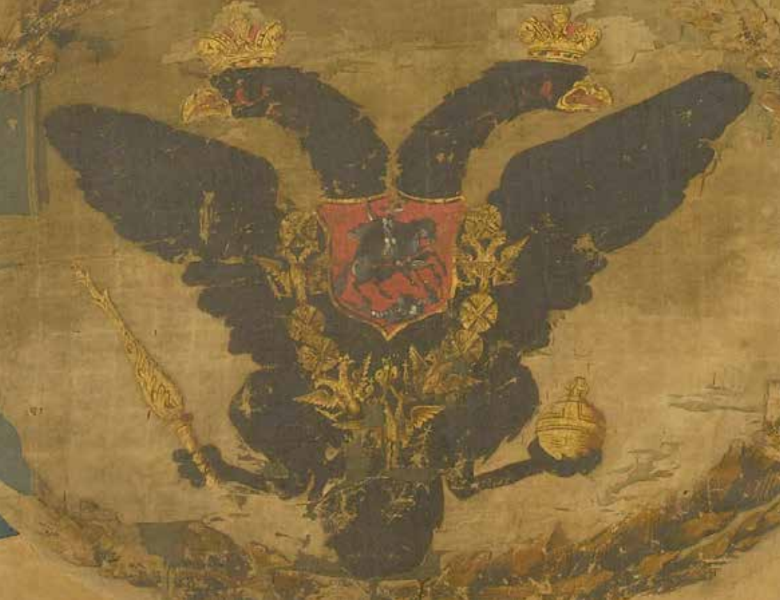
Drapeau de bataillon d'un régiment d'infanterie russe